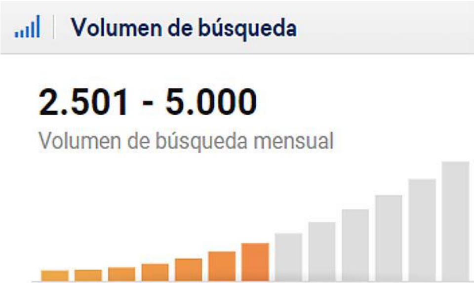
Figura 3.- Evolución sobre las búsquedas sobre “burnout”

Las búsquedas se producen, sobre todo, en octubre y noviembre (los meses posteriores a las vacaciones de verano -julio, agosto y septiembre en Europa-) o en febrero, marzo, abril (mes en el que también baja el número de búsquedas por la Semana Santa) y mayo. En los meses de diciembre y enero también bajan las búsquedas de la palabra burnout por las vacaciones de Navidad (Figura 3).